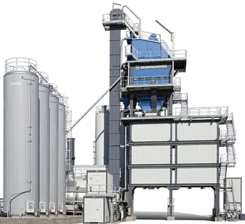
Die TBA 3000 Asphaltmischanlage.

Natürlich vorkommende oder technisch hergestellte Gemische aus Gesteinskörnungen und dem Bindemittel Bitumen werden nach DIN 55946 als Asphalte bezeichnet. Natürlicher Asphalt entsteht aus Erdöl, wenn es Sauerstoff aufnimmt und die leicht flüchtigen Inhaltsstoffe verdunsten. Das Naturprodukt diente schon 3.000 vor Christus in Mesopotamien als Baumaterial. Asphalt wird heute technisch in Mischwerken hergestellt. Verwendet wird Asphalt meist im Verkehrswegebau - hauptsächlich für Strassen, Wege und Plätze. Weitere Einsatzbereiche liegen im Hochbau, beispielsweise als Gussasphaltestrich, und der Abdichtung von Bauwerken und Deponien.