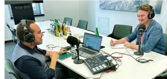
LinkedIn Audio #einehalbeStunde Zoll – in Hamburg bringt Ziegler «etwas auf die Ohren».

len, Erfahrungen und Neuigkeiten aus der Branche auf den Grund. Die Events sind öffentlich – jeder mit einem LinkedIn-Profil kann teilnehmen. Live beantworten wir Fragen aus unserer LinkedIn-Community zu Themen rund um Zoll- und Aussenwirtschaftsrecht. Mit zwei Episoden waren wir bereits online: Basics des Zollrechts und Berechnung des korrekten Zollwerts. Dabei treten wir mit unterschiedlichen Teilnehmern verschiedener Branchen in Kontakt. In kleiner und persönlicher Runde beantworten wir Zollfragen und geben erste Hilfestellung.