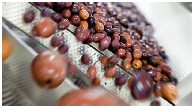
Eine Oliven-Schüttelrinne bei Dumet.

Oliven, die erst spät gepflückt werden (in Farbe sind diese dann violett bis braun). Wichtig ist aber, dass die Oliven im Endprodukt nicht thermisch behandelt werden – sonst gehen Geschmack und Konsistenz verloren.