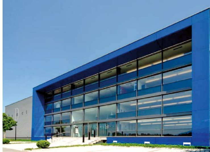
Dumet Gebäude Front II in der Schweiz.

Nun das ist Geschmackssache. Entweder man mag grüne knackige Oliven oder schon etwas reifere und weichere