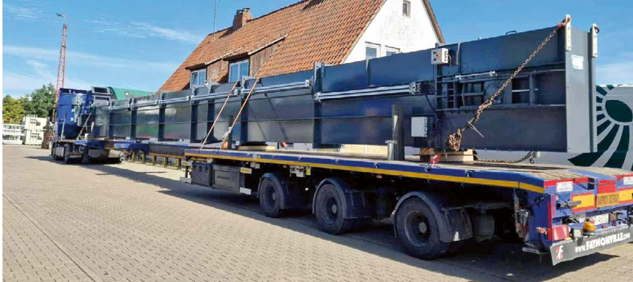
Spezialtransport im Einsatz – der Telesattel.