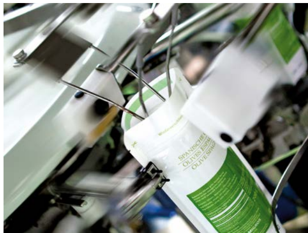
Schonende Abfüllung in Beuteln.

Ihre Fachkompetenz, Flexibilität und Zuverlässigkeit der Transporte! Mit ihrem grossen Netzwerk können sie all unsere Anliegen bestens und schnell erfüllen (Seefracht, Stückgut-Sendungen, Komplettladungen oder Sonder-sendungen). Mit ihrer internen Zollabteilungen stehen sie uns auch bei Zollproblemen oder Zollanfragen mit Rat und Tat zur Seite. Somit haben wir den perfekten Partner für unsere Sendungen.