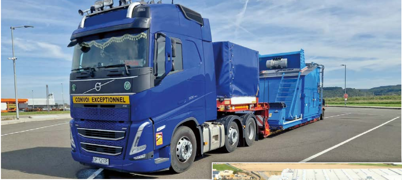
Eine Siebmaschine 8,70 x 3,70 x 3,90 Meter, 23 Tonnen.

John Deere. Benninghoven produziert u.a. selbst im heutigen Werk in Wittlich.