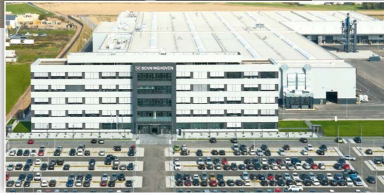
Benninghoven in Wittlich.

Für die jeweiligen Marktanforderungen gibt es die passende Anlagenlösung: Ob transportabel oder stationär, in Leistungsgrößen von 100 - 400 t/h – eines ist dabei immer gleich: Benninghoven bietet die zeitgemähesten Lösungen, um Asphalt wirtschaftlich, flexibel und umweltschonend zu produzieren.