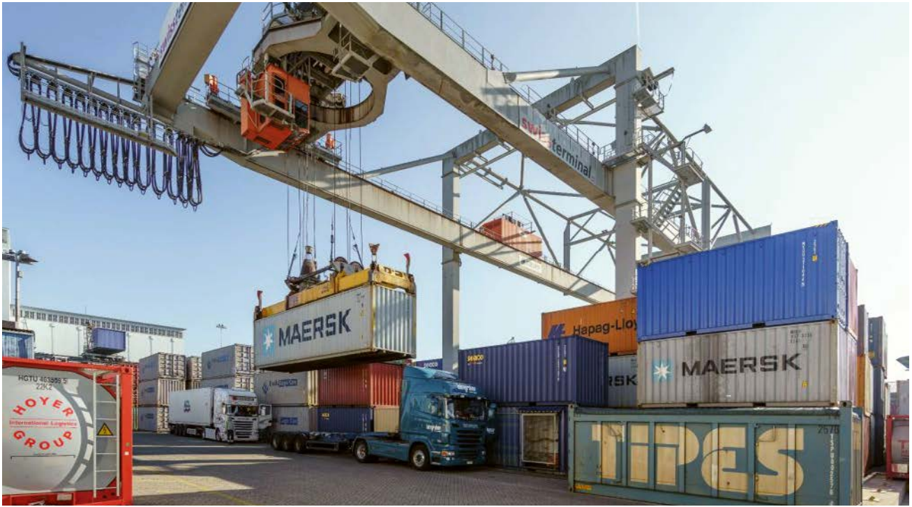
Multimodaler Containerumschlag am Baseler Hafenteil Kleinhüningen.