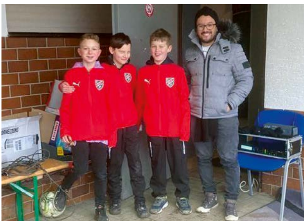
Glücklich: Kinder und Nachwuchssportler im Ahrtal mit neuer Sportkleidung.