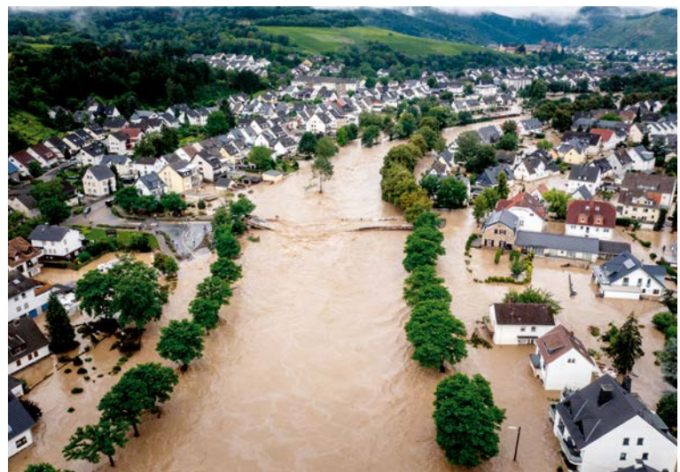
...die Flutkatastrophe zerstörte Häuser, Ortschaften und Existenzen – aber auch Sportanlagen.