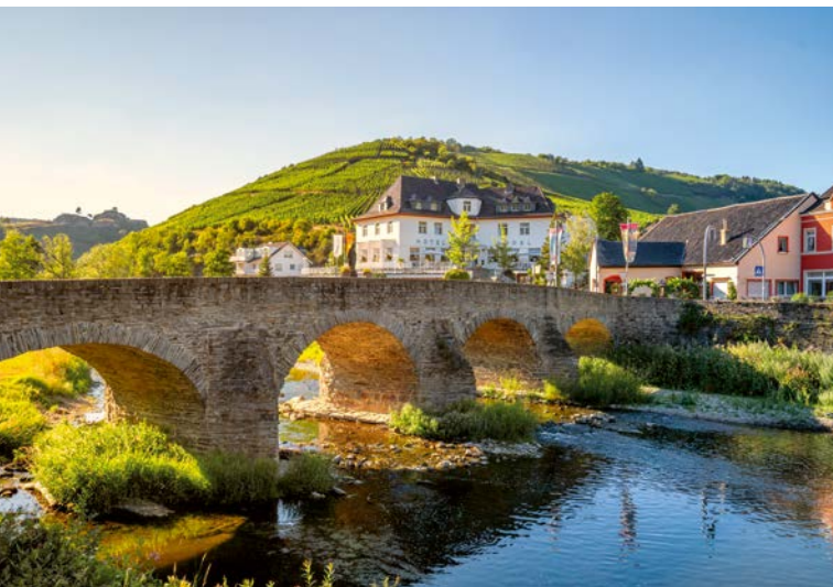
Wunderschöne Landschaft, bedeutende Weinbauregion: das Ahrtal, aber...

Hier musste geholfen werden: Innerhalb weniger Stunden verwüstete ein Hochwasser das Ahrtal – auch die Sportplätze, die an der Ahr lagen. Fussballplätze wie die von der Fussball-Spielgemeinschaft SG Ahrtal waren komplett zerstört und nur noch eine Schlammlandschaft. Nach dem Motto „Fussball hilft Fussball“ organisierte der begeisterte Fussballer und Trainer Roland Paolucci aus Basel eine Hilfslieferung zusammen mit der Embolo-Foundation, in der er schon lange aktiv ist.