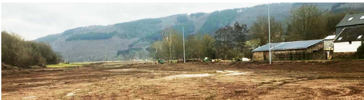
Trostlos und voller Schlamm: der von der Flut zerstörte Fussballplatz.

Hier musste geholfen werden: Innerhalb weniger Stunden verwüstete ein Hochwasser das Ahrtal – auch die Sportplätze, die an der Ahr lagen. Fussballplätze wie die von der Fussball-Spielgemeinschaft SG Ahrtal waren komplett zerstört und nur noch eine Schlammlandschaft. Nach dem Motto „Fussball hilft Fussball“ organisierte der begeisterte Fussballer und Trainer Roland Paolucci aus Basel eine Hilfslieferung zusammen mit der Embolo-Foundation, in der er schon lange aktiv ist.